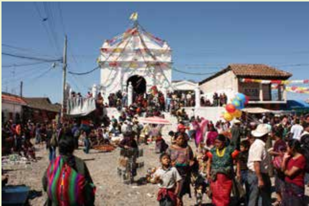
CHICHICASTENANGO - Kirche Santo Tomas

Nach dem Frühstück besichtigen wir die Kirche Santo Tomas am Hauptplatz wo die Einheimischen beten und Weihrauch für ihre Götter anzünden. Jeden Donnerstag und Sonntag wird hier auch der bekannteste und wohl schönste Markt abgehalten. Das ganze Dorf verwandelt sich zu einem großen Markt wo alle möglichen Waren feilgeboten werden, Hauptakteure sind hier Frauen in ihren traditionellen Trachten. Mittagessen und am Nachmittag Rückfahrt nach Antigua. Abendessen und Übernachtung im Hotel.