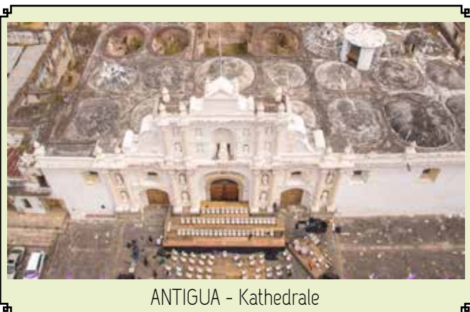
ANTIGUA - Kathedrale

Nachdem Frühstück erkunden wir bei einer Stadtbesichtigung die ehemalige Hauptstadt Zentralamerikas - Antigua. Wir entdecken koloniale Schätze, den Regierungspalast, den Stadtplatz "Plaza de Armas" und die Kathedrale. Das 1773 durch ein Erdbeben fast völlig zerstörte Antigua wurde in Teilen wieder aufgebaut und aufgrund seiner reichen kolonialen Vergangenheit von der UNESCO zum Weltkulturerbe erklärt.