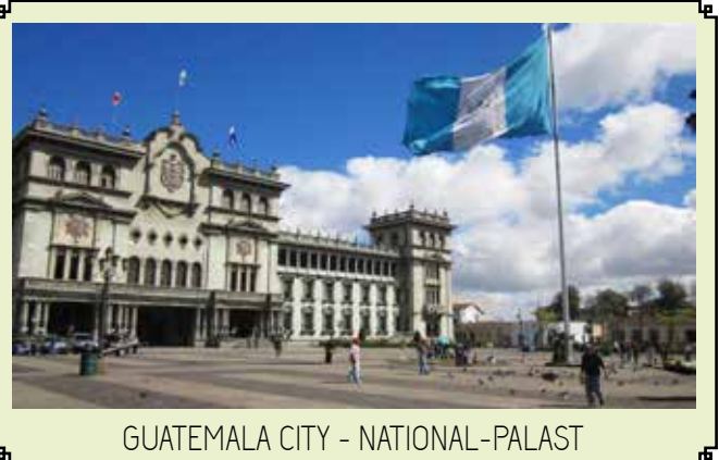
GUATEMALA CITY - NATIONAL-PALAST

Nach dem Frühstück, Transfer zum Flughafen Flores und Flug nach Guatemala City. Hier besuchen wir das Stadtzentrum, wo es einige der schönsten Gebäude Guatemalas gibt, wie das National Theater, das Rathaus und das Gerichtsgebäude, der Hauptplatz, wo sich der National-Palast befindet und Regierungssitz seit 1931 ist.